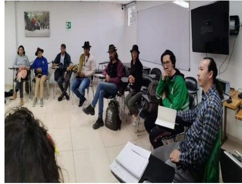
Figura 1 y 2. Fotografías reunión de articulación y diálogo con CIMS 23/02/2024.