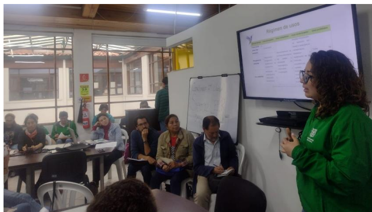
Figura 11. Presentación avances PMA PDEM Cerro de la Conejera en CAL Suba.

A partir de la presentación de los elementos estructurales del documento del Plan de Manejo Ambiental como la caracterización, zonificación, régimen de usos del suelo y las propuestas de estrategias de manejo, se presentó ante la Comisión Ambiental Local (CAL) de Suba los avances en el documento, a partir de lo cual se tejió un dialogo, se resolvieron inquietudes y se recopilaron aportes y propuestas por parte de las organizaciones y líderes ambientales participantes en el escenario, resaltándose los aportes en términos de las estrategias de manejo que fortalezcan la conectividad del PDEM Cerro de La Conejera con los demás elementos de la EEP presentes en la zona.