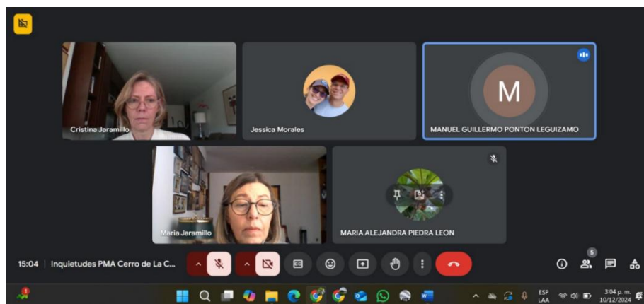
Figura 12. Reunión con representantes inversiones Furatena S.A. y de la Corporación Universidad Minuto de Dios (UNIMINUTO).

En reunión virtual del 10/12/2024 se expone el contexto del proceso de formulación del Plan de Manejo Ambiental del PDEM Cerro de La Conejera, realizando una breve explicación de su marco normativo, la estructura del instrumento y antecedentes. Posteriormente, se hace una exposición general de las cuatro estrategias de manejo definidas en el PMA. Se recibieron preguntas y dudas por parte de las representantes de inversiones Furatena S.A. y de la Corporación Universidad Minuto de Dios (UNIMINUTO) en relación con la estrategia Acuerdos de conservación , enfatizando en el fortalecimiento de los mecanismos de articulación interinstitucional para mitigar las problemáticas de ocupaciones en los predios que se encuentran al interior del área protegida, con el fin de desarrollar procesos de restauración, educación ambiental y mejoramiento de la coordinación interinstitucional.