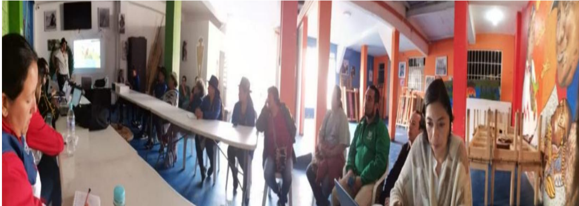
Figura 6. Fotografías Taller en CIMS 29/02/2024.