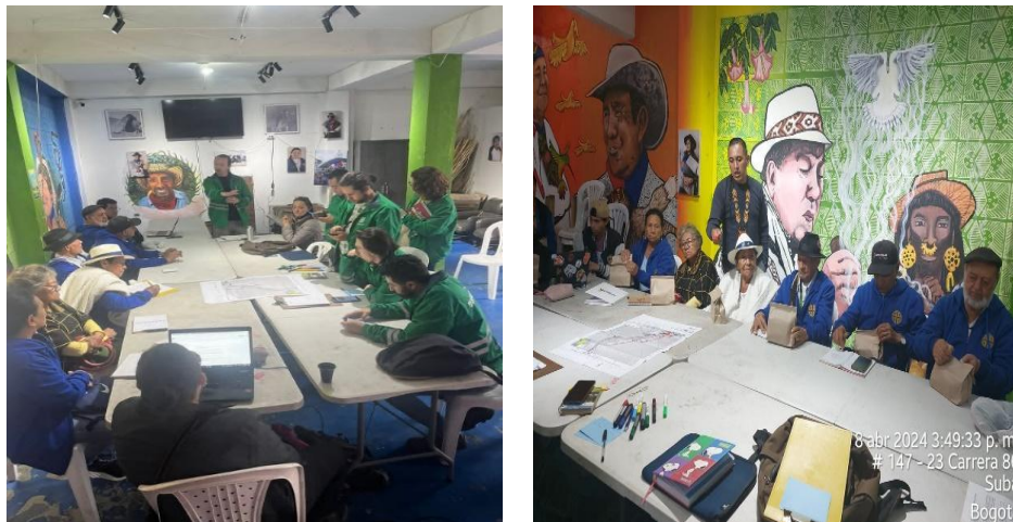
Figura 8 y 9. Segundo taller participativo de caracterización del PDEM Cerro de La Conejera con el Cabildo Indígena Muisca de Suba.

Posteriormente, se realiza un ejercicio de identificación de usos y costumbres relacionados a las especies de flora de importancia cultural registradas para el Cerro de La Conejera con el fin de que la comunidad reconociera y confirmara su presencia y al mismo tiempo identificara su importancia cultural como el uso (Maderable, medicinal, cultural, entre otras) y sus nombres propios en lengua Muisca (Muysccubun).