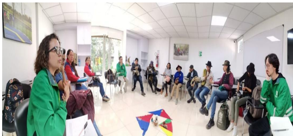
Figura 3. Fotografías reunión de articulación y diálogo con CIMS 23/02/2024.