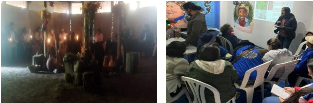
Figura 4 y 5. Diálogo de saberes en el Qusmuy y Taller en sede CIMS 29/02/2024.

Como tercer momento del taller se propone la metodología de trabajo en dos mesas paralelas para el desarrollo de la caracterización histórica de poblamiento y de usos de flora y fauna. En donde en diálogo con los comuneros del cabildo se identifican los procesos históricos de usos y poblamiento en el Cerro de La Conejera y la relación con la fauna y flora que desde el CIMS históricamente se ha tejido.